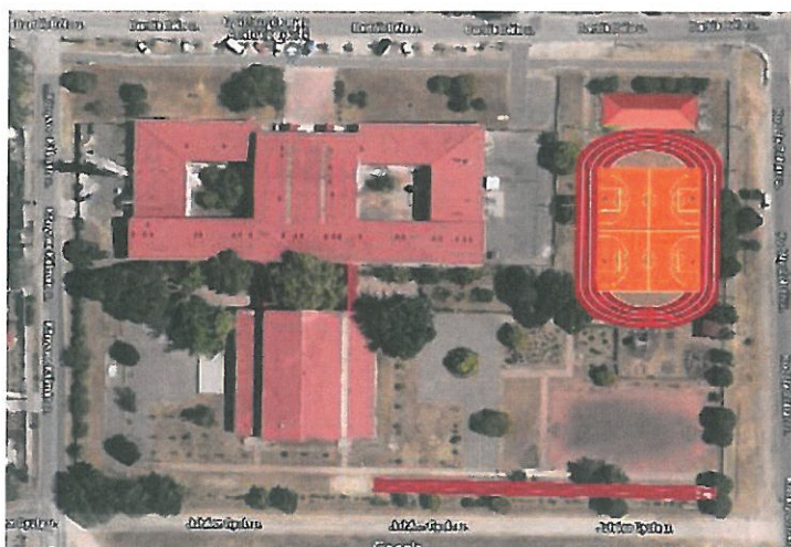
A képen a sportpálya látványterve látható